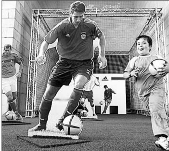
Un niño sorteaba las figuras de Raúl y Zidane en una feria de la UEFA.

Los rusos son gente seria. Con toda seriedad hacen pre-